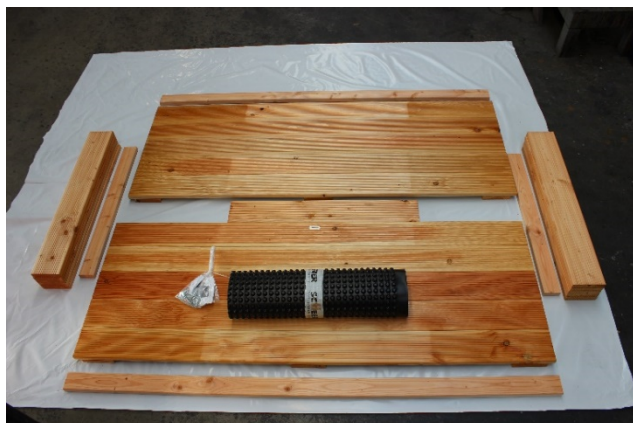
Hochbeetbausatz nach Auspacken inkl. Beschlag

Wichtig: Alle Schraubenlöcher vorbohren!